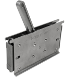
Outils de maintien Roxtec